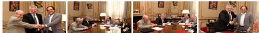
Convenio entre la Secretaría Cultura de la Nación y la Universidad de Río Negro