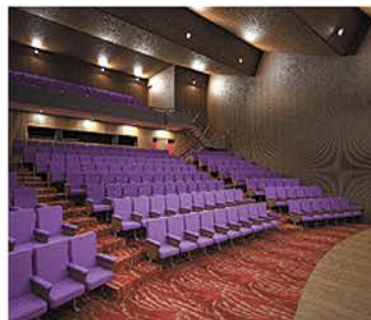
Al Goga le falta un 30 por ciento de obra, después de dos millones de dólares de inversión.