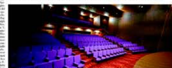
El Goga le falta un 30 por ciento de obra, después de dos millones de dólares de inversión.